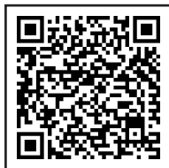
Hospital and Clinic Network Provider List